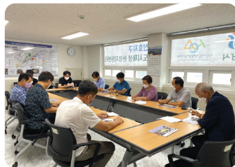
주민협의체 활동 운영지원