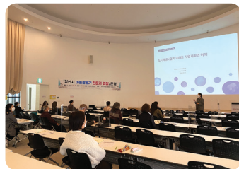
도시재생 관련 분야 전문교육