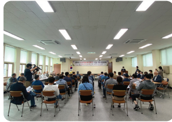
도시활성화 방안 기획·연구