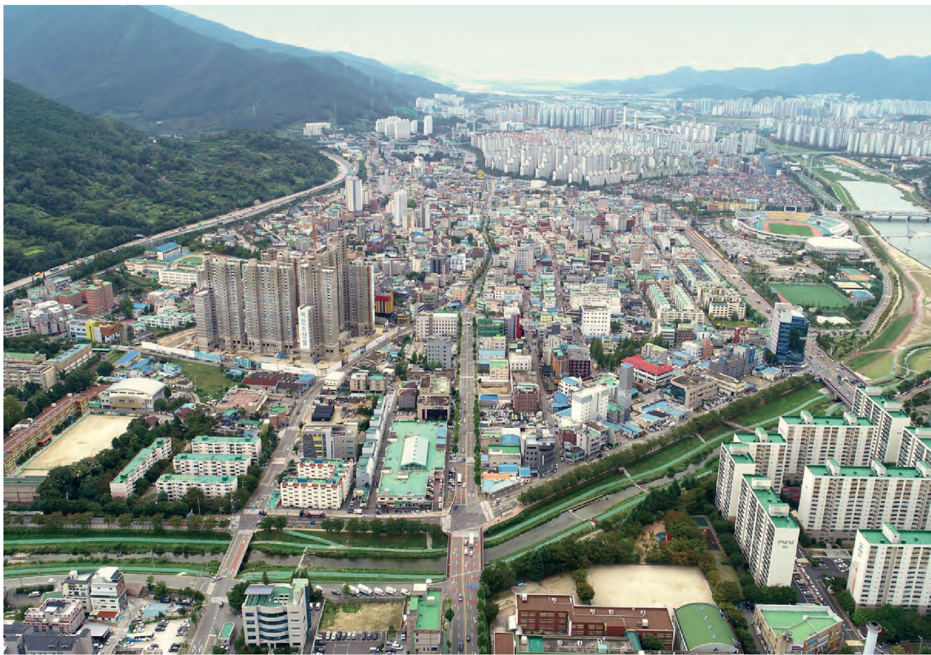
양산시 원도심 전경

발행일 2021. 12. | 발행처: 양산시 도시재생지원센터 | 주소: 경상남도 양산시 북안남 2길 33-1(북부동) 3층 | 전화: 055-367-9195~7